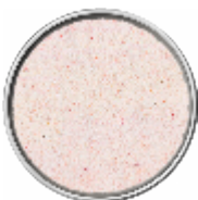
Sale Rosa Fino