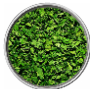
Prezzemolo - Liofilizzato