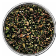
Menta - Essiccata