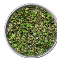
Agnello - Sale Aromatico