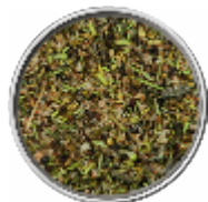
Grill-Mediterraneo - Sale Aromatico