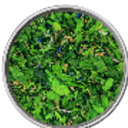
Erbe Selvatiche - Miscela di Erbe e Fiori