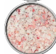
Sale Rosa Grosso