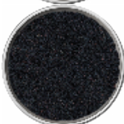
Semi di Sesamo Nero - Interi