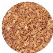
Cipolle Arrostate - Tritate