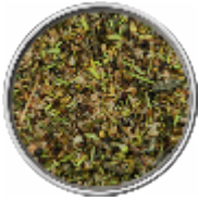
Grill-Mediterraneo - Sale Aromatico