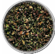
Menta - Essiccata