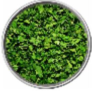
Prezzemolo - Liofilizzato