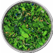
Erbe Selvatiche - Miscela di Erbe e Fiori