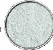
Fiocchi di Sale Marino