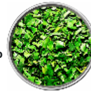
Basilico - Liofilizzato