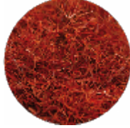
Fili di Zafferano - Qualità Eccellente