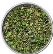
Agnello - Sale Aromatico