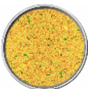
Brodo Vital di Verdura