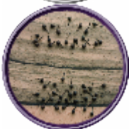
Pepe di Voatsiperifery, Intero