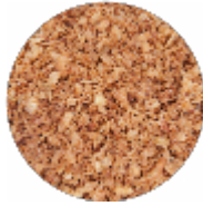
Cipolle Arrostate - Tritate