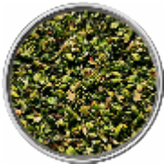
Origano - Essiccato