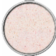
Sale Rosa Fino