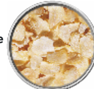
Aglio a Fette