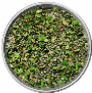
Agnello - Sale Aromatico