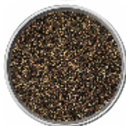
Pepe Nero Macinato Grosso