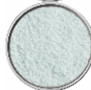
Focchi di Sale Marino