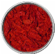
Fiocchi di Pomodoro