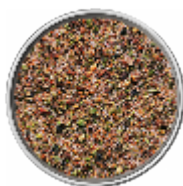
Maiale - Croccantino Rustico - Sale Aromatico