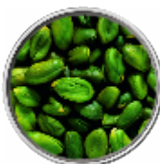
Pistacchi - Sgusciati