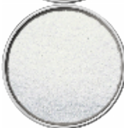
Preparato per la Stabilizzazione del Colore, Bianco