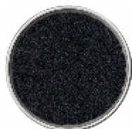
Semi di Sesamo Nero - Interi