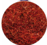
Fili di Zafferano - Qualità Eccellente