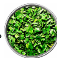
Basilico - Liofilizzato