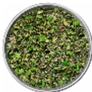
Agnello - Sale Aromatico