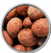
Noce Moscata Intera