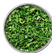
Salvia - Liofilizzata