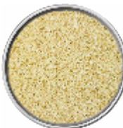
Semi di Sesamo Sgusciati - Interi