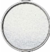
Preparato per la Stabilizzazione del Colore, Bianco