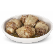
Carciofi Rustici in Olio di Girasole