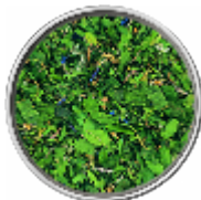
Erbe Selvatiche - Miscela di Erbe e Fiori