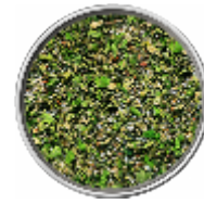
Agnello - Sale Aromatico