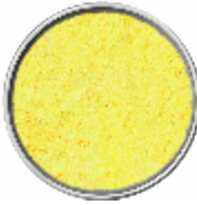
Mago Panata - Panatura Senza Pangrattato