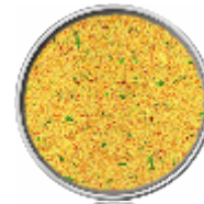
Brodo Vital di Verdura