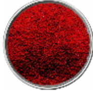
Paprica Rubino - Delicata