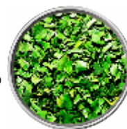
Basilico - Liofilizzato