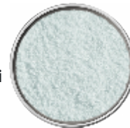
Focchi di Sale Marino