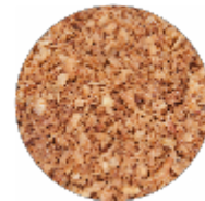
Cipolle Arrostate - Tritate