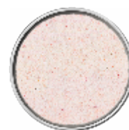
Sale Rosa Fino